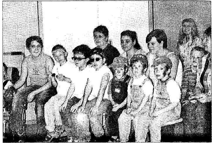
Foto einer Entlassfeier: In der Heilpädagogischen Tagesstätte werden die Bewegungsabläufe und die Sprache der Kinder trainiert.

Die Einrichtung wurde 1978 als „Sonderkindergarten für geistig behinderte Kinder“ in Bergheim-Thorr gegründet. Vier Jahre später wurde sie in „Heilpädagogische Tagesstätte“ umbenannt. 1988 gründete sich der Förderverein „Kinderbrücke“, ein Jahr später zog die Tagesstätte nach Elsdorf um, wo 1994 das große